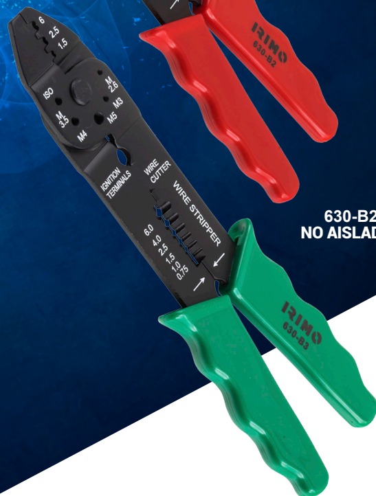
630-B3-1 NO AISLADO, TIPO FASTON