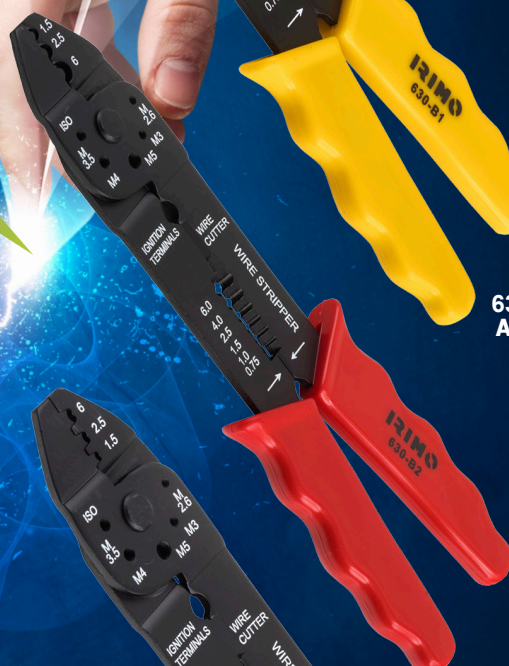
630-B2-1 NO AISLADO